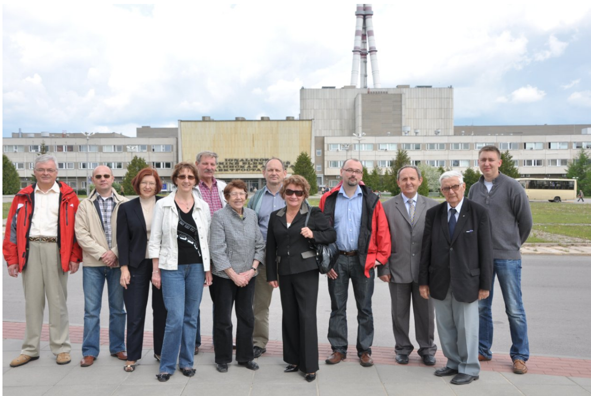
Zdjęcie na tle Elektrowni Atomowej w Ignalinie