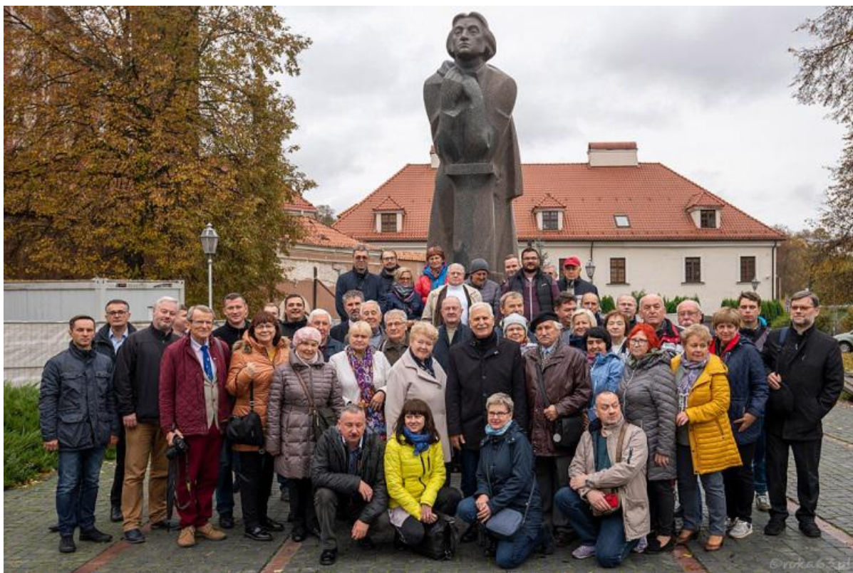
Uczestnicy sympozjum z okazji 100-lecia SEP, pod pomnikiem Adama Mickiewicza w Wilnie.

W dniach 12-15.10.2019 r. w Wilnie odbyły się jubileuszowe obchody 100-lecia SEP zorganizowane przez trzech organizatorów: Stowarzyszenie Elektryków Polskich, Polsko-Litewską Izbę Handlową, Stowarzyszenie Naukowców Polaków Litwy i Ambasadę Rzeczypospolitej Polskiej w Wilnie. Głównym celem uroczystości była prezentacja dorobku i osiągnięć elektryków polskich i litewskich w okresie 100-lecia SEP oraz osiągnięć naukowo-technicznych instytucji i stowarzyszeń działających na terenie Litwy, a także omówienie propozycji wzajemnej współpracy.