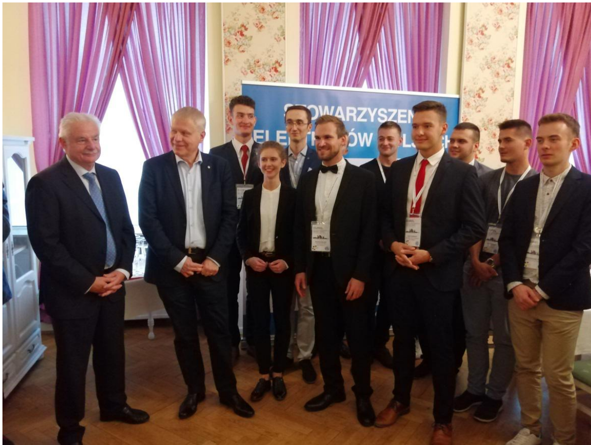
Uczestnicy EUREL IMC w Warszawie – 18-20.09.2019r.

https://www.eurel.org/en/events/international-management-cup