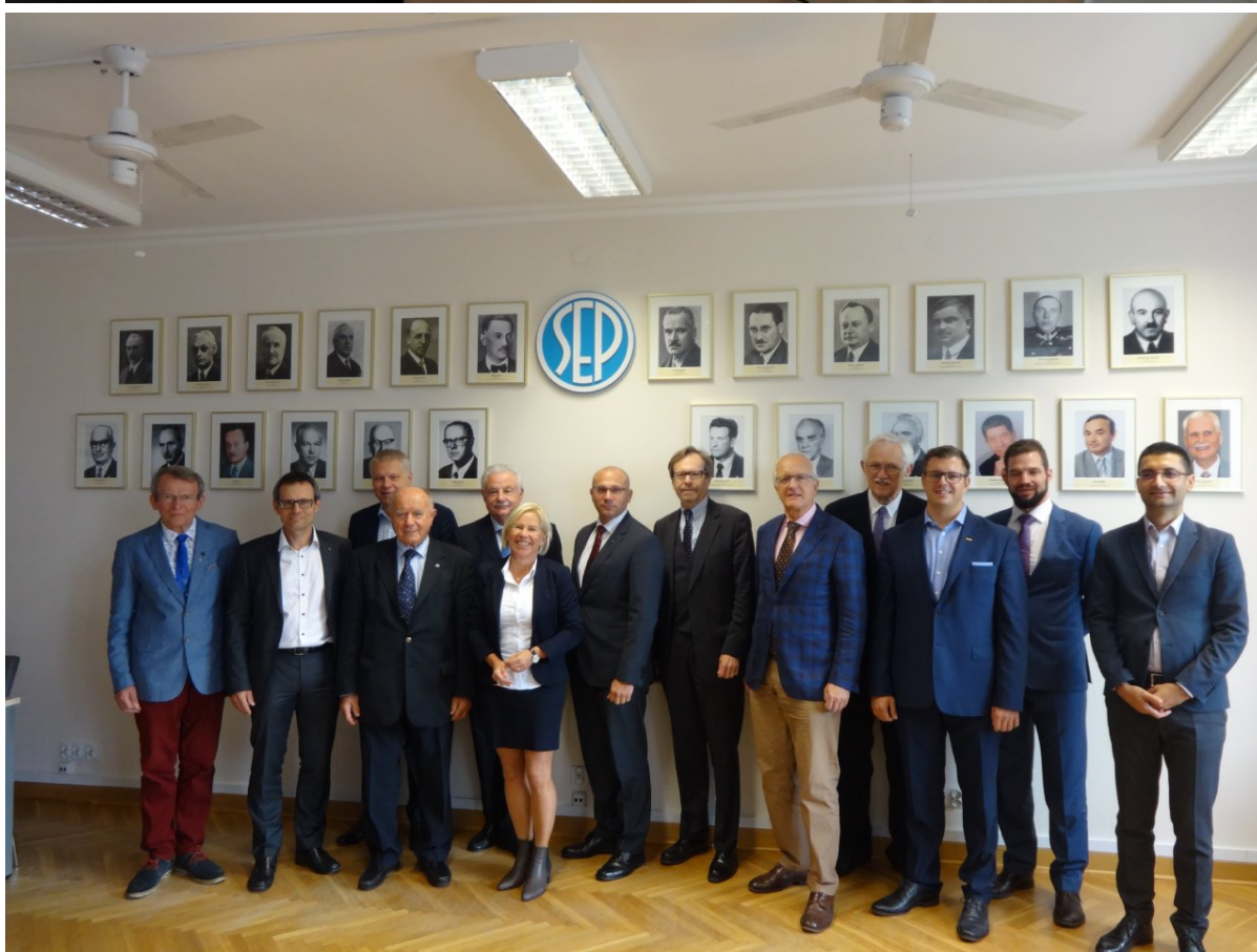
Uczestnicy EUREL General Assembly, w sali konferencyjnej