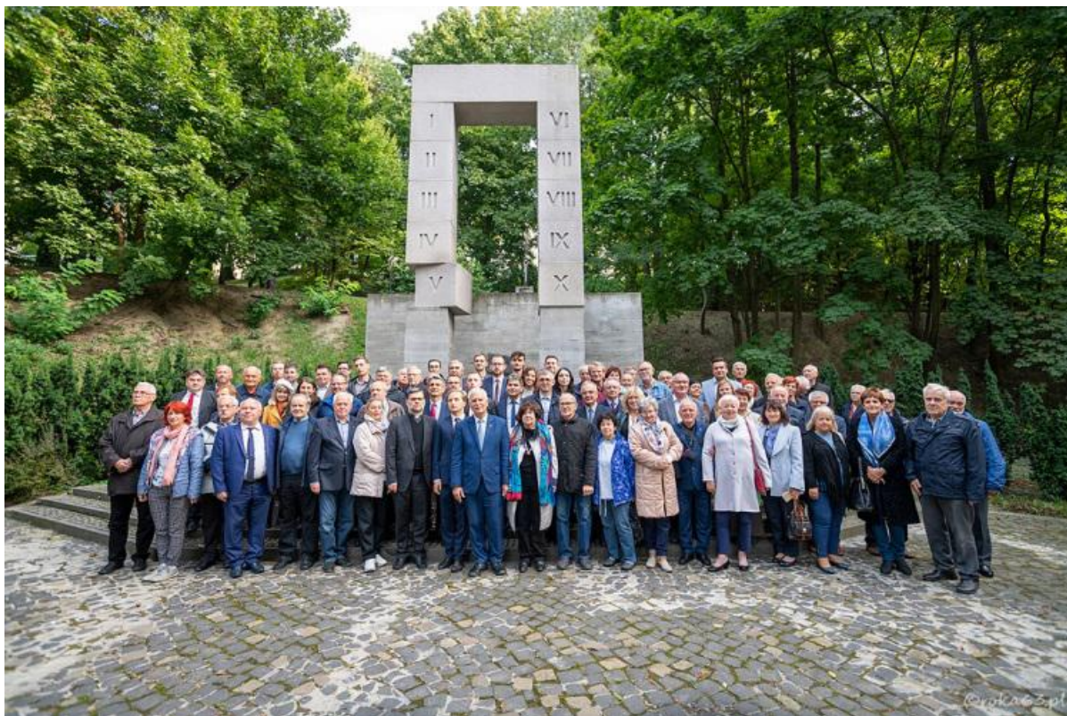
Uczestnicy uroczystości 100-lecia SEP we Lwowie, przed pomnikiem pomordowanych Profesorów Lwowskich na Wzgórzach Wuleckich.

Zostały podpisane ramowe umowy o współpracy pomiędzy SEP i Instytutem Elektrodynamiki NAN Ukrainy oraz SEP i Związkiem Naukowo-Technicznym Energetyków i Elektrotechników Ukrainy.