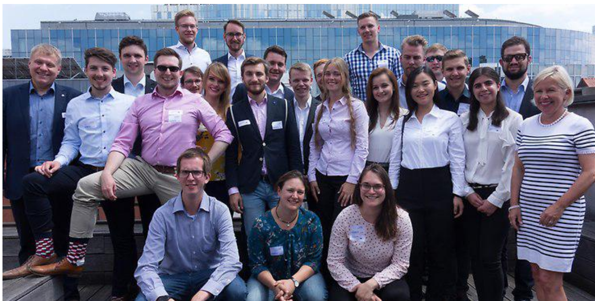
Uczestnicy EUREL YOUNG ENGINEERS' SEMINAR (YES) w Brukseli – 5.07.2019r.

https://sep.com.pl/aktualnosci/eurel-young-engineer-s-seminar-2019-bruksela-4-5-lipca-2019-r.html