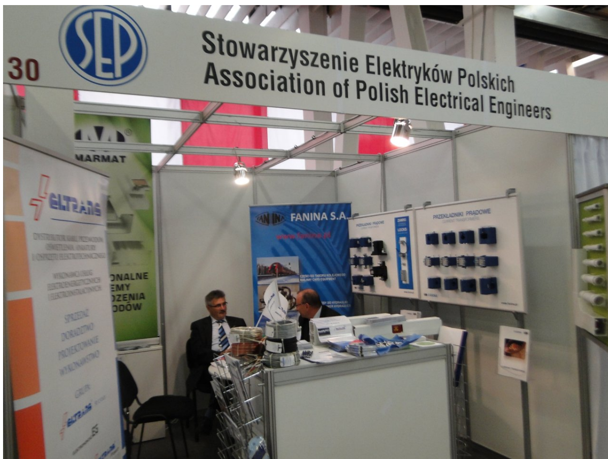
Stoisko SEP na Targach ELO SYS w 2014 r.