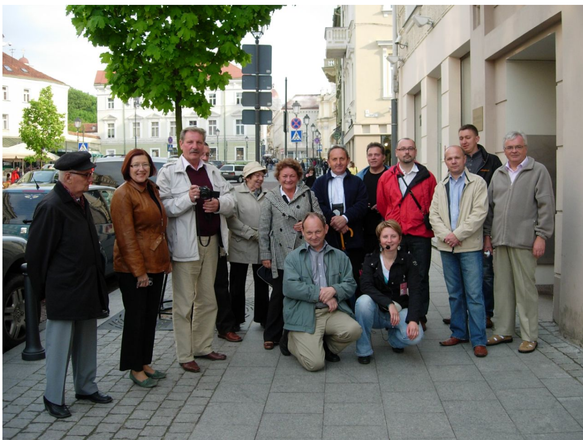
Uczestnicy wyjazdu do Wilna w 2009r.