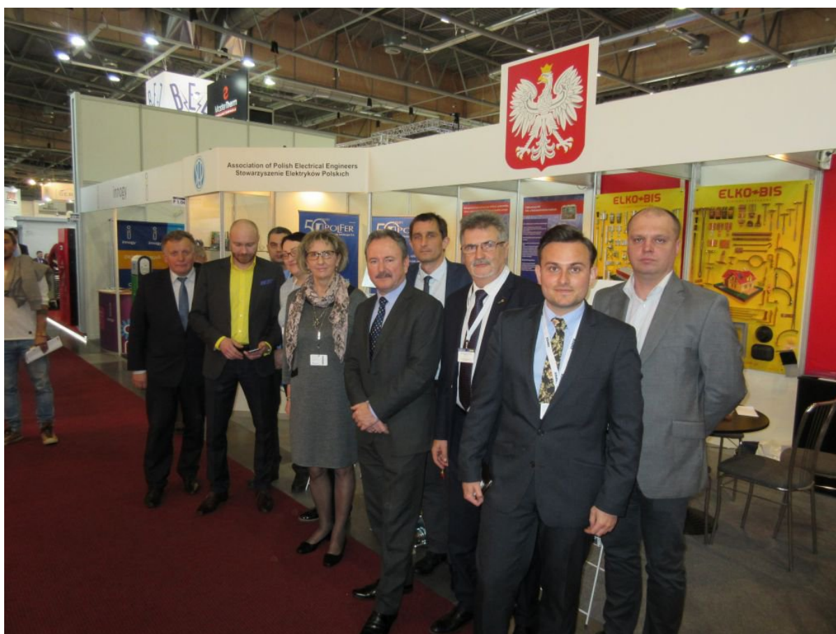
Uczestnicy wspólnego stoiska SEP i Ambasady RP w Pradze, na Targach AMPER 2017