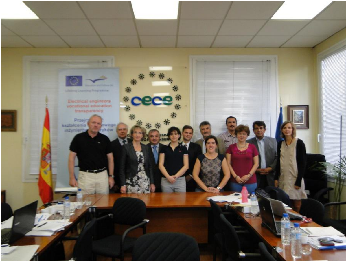
Uczestnicy spotkania Komitetu Sterującego i Komitetu Monitorującego Projektu ELEVET w Madrycie, wrzesień 2012r.