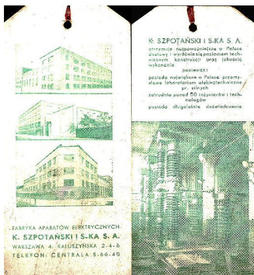
Reklama FAE K. Szpotańskiego, zakładka książki, 1938 r.

W okładce kalendarzyka była ukryta zakładka do książki, na której po obu jej stronach umieszczona była reklama największej w Polsce Fabryki Aparatów Elektrycznych Kazimierza Szpotańskiego. Wyroby FAE w latach 30-tych charakteryzowały się wysokim poziomem technicznym.